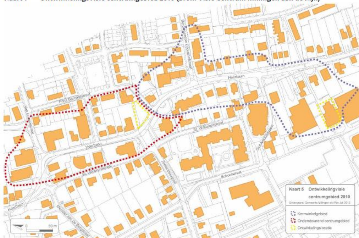
Kaart 1 Ontwikkelingsvisie centrumgebied 2010